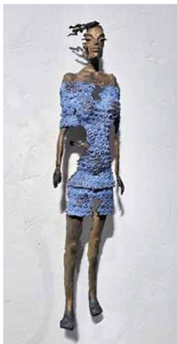
Amir Omerović, O.T., Bronze, Unikat, H 43 cm