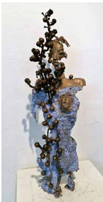
Amir Omerović, O.T., Bronze, Unikat, H 38 cm

Atelier Brandt Credo Meyerstr. 145, 28201 Bremen sonntags von 16–18 Uhr Individuelle Besichtigungstermine nach Abgabe unter Tel. 55 84 55 jederzeit möglich. 2.5. – 12.7.2026 Ausstellungseröffnung am Sonnabend, 2.5.2026 von 16 – 19 Uhr